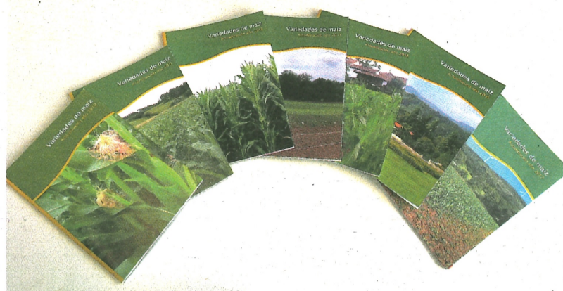
Figura 2. Colección de Informes Técnicos SERIDA sobre “Evaluación de variedades de maíz”. Disponible la evaluación de 2019 en: http://www.serida.org/pdfs/8069.pdf

El objetivo de esta evaluación es que exista información veraz y adaptada a la hora de elegir las variedades a sembrar al año siguiente, en función de los resultados de comportamiento agronómico y contenido en principios nutritivos en una zona determinada. Esto es necesario,