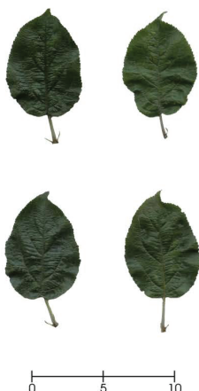
Figura 2.-Ficha de la variedad Amariega.