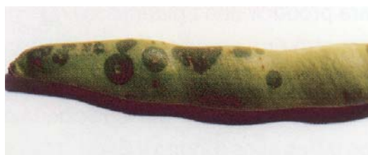
Fotografía 4. Daños típicos de "grasa". A la izquierda, manchas rodeadas de un halo clorótico en las hojas. Arriba, vaina de faba mostrando las típicas manchas aceitosas características de la enfermedad.