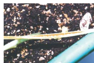
Fotografía 5. Daños producidos en faba por Pseudomonas viridiflava BT2. Arriba, manchas rojizas; abajo, daños en la médula.