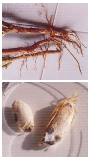
Fotografía 2. Arriba, raíces mostrando el típico "moho blanco" característico de la infección por Sclerotinia sclerotiorum . Abajo, semillas con "esclerocios" del hongo que son las formas de resistencia del mismo.

E n el Laboratorio de Fitopatología del SERIDA se lleva trabajando en el estudio de las enfermedades que afectan al cultivo de la faba granja asturiana más de tres lustros. Entre las enfermedades más frecuentes producidas por hongos destacan la antracnosis, el oidio y la botritis, que dañan a la parte aérea; y la fusariosis y la rizoctoniosis, que infectan al cuello y raíz de las plantas. También es frecuente una enfermedad bacteriana conocida como "mancha parda" con la que nuestros cultivos conviven desde hace años y la presencia del virus del mosaico común de la judía. Sin embargo, no es de estas enfermedades de las que vamos a hablar aquí, si no de las que denominamos emergentes que son aquellas de nueva aparición o que cobran una especial relevancia en determinado momento.