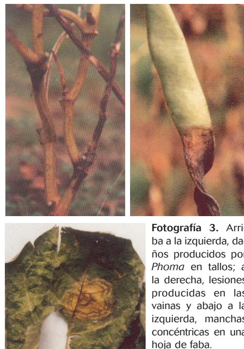
Fotografía 3. Arriba a la izquierda, daños producidos por Phoma en tallos; a la derecha, lesiones producidas en las vainas y abajo a la izquierda, manchas concéntricas en una hoja de faba.

Todos estos hongos son susceptibles de transmitirse por semilla, de ahí la gran importancia de utilizar semilla saneada.