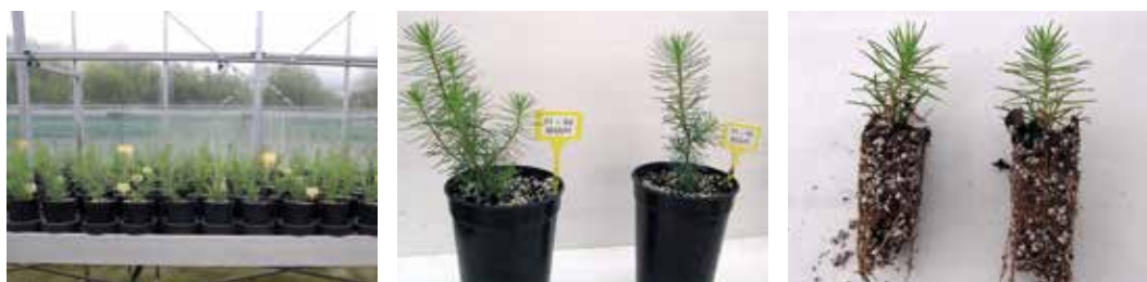
← Figura 1. Vista general de plantas madre (izquierda), detalle de las mismas (centro) y planta clonada (derecha) de pino pinaster.

El cerezo es, y ha sido, muy apreciado como componente de la diversidad de los ecosistemas forestales de toda Europa, donde se extendió procedente de Asia occidental, acompañando al hombre desde tiempos remotos. A nivel mundial, se encuentra difundido por numerosas regiones y países con clima templado (Rusell, 2003), demostrando ser una especie con una gran capacidad de adaptación a distintas condiciones climatológicas, ya que lo podemos encontrar desde Gran Bretaña al Cáucaso y desde el norte de África a los países escandinavos (López-González, 2001; Montero et al., 2003). En España, esta especie se distribuye sobre todo por la mitad norte peninsular, siendo un árbol frecuente en Galicia, especialmente en la mitad oriental de la región (Álvarez et al., 2000), si bien Las Regiones de Identificación y Utilización de material forestal de reproducción (RIU's) números 7 y 9, pre-Pirineo y bosques vasco-navarros, son