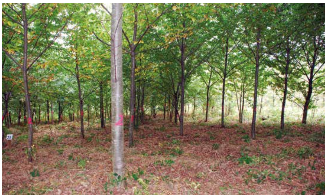
← Figura 3. Material clonal de híbridos de castaño interespecíficos.

región, registrándose recientemente 11 de ellos en la Oficina Española de Variedades Vegetales del Ministerio de Agricultura y Pesca, Alimentación y Medio Ambiente (BOE nº 60, de 11 de marzo de 2017).