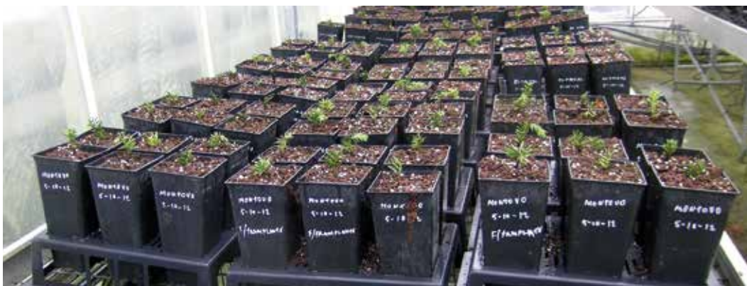
← Figura 8. Clones ya enraizados de los tejos seleccionados por su interés histórico.