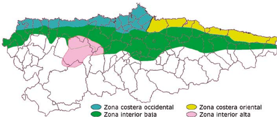
Figura 1. Zonas edafoclimáticas de Asturias aptas para el cultivo de maíz forrajero.