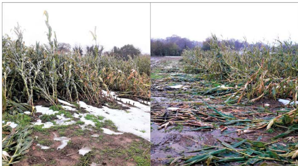
Imagen 1. Efecto de las primeras nevadas en la zona interior alta en las fechas previstas para la cosecha de las variedades de ciclo largo.

Las condiciones termopluiométricas para cada zona de ensayo durante los meses de desarrollo del cultivo se muestran en la tabla 2.