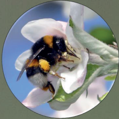
Abejorro Bombus terrestris