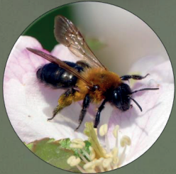
Abeja silvestre Andrena nitida