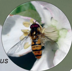
Sírido Episyrphus balteatus