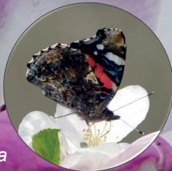
Mariposa Vanessa atalanta