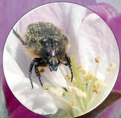
Escarabajo Oxythyrea funesta