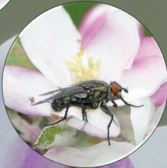
Mosca Tricogena rubricosa