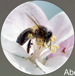
Abeja de la miel Apis mellifera

Con más de 100 especies, la comunidad polinizadora del manzano de sidra en Asturias es sorprendentemente diversa