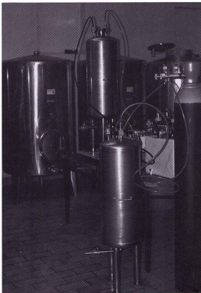
Filtro cerámico tangencial

apropiado (Indicación Geográfica Protegida, Denominación de Origen), que posibilite la obtención de productos derivados de la manzana que estén sometidos a un control de calidad satisfactorio, lo que sin duda repercutirá además en la deseable mejora de la competitividad entre las industrias de la sidra. También cabe resaltar el empeño que los industriales sidreros del Principado de Asturias han puesto en la elaboración de un nuevo Reglamento Técnico Sanitario que garantice la modernización, el seguimiento y el control de la