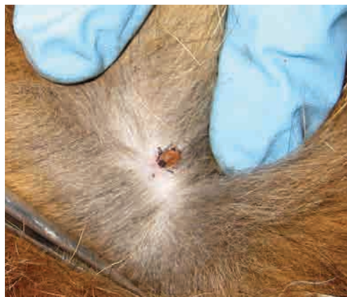
← Garrapata adulta fijada a la piel de un zorro.