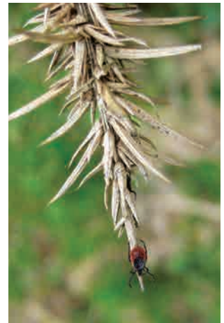
↑ Garrapata sobre la vegetación esperando el paso de un hospedador.

Todavía no se cuenta con suficiente información y hay bastante controversia sobre que especies domésticas y silvestres pueden actuar de reservorio de Borrelia burgdorferi . La identificación de los principales reservorios de la Enfermedad de Lyme en España se encuentra pendiente de determinar. No obstante, al igual que se ha demostrado en Estados Unidos con el ratoncillo blanco ( Peromyscus leucopus ), distintas especies de roedores e insectívoros muy abundantes en nuestra región son buenos candidatos a actuar de reservorios.