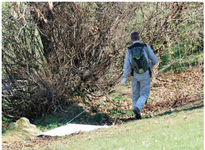
↓ Recogida de garrapatas de la vegetación mediante el método de arrastre de una tela.