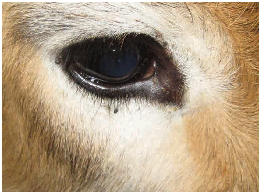
↑ Larvas de garrapatas en párpado y conjuntiva de una vaca.