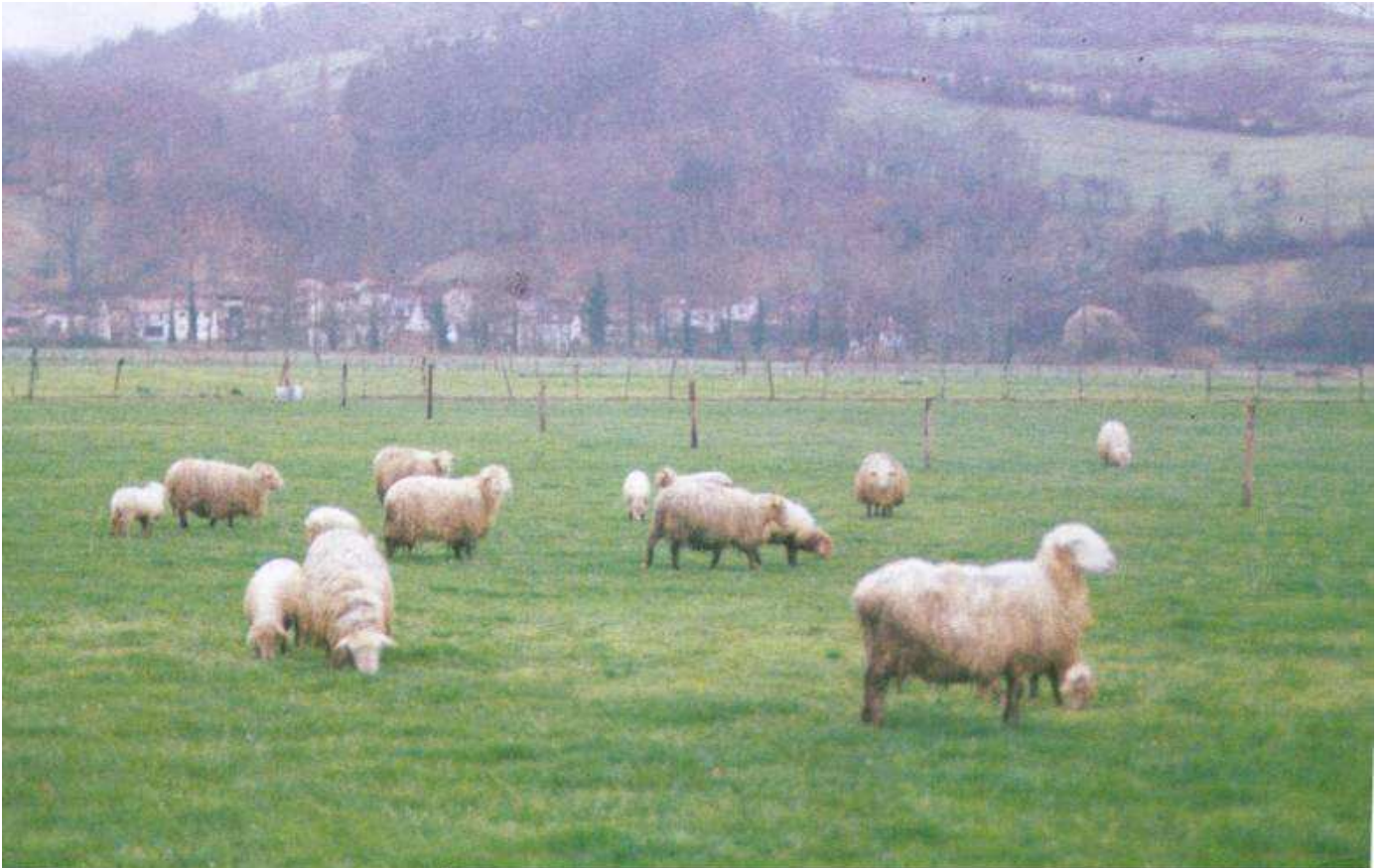
Rebaño de ovejas en la finca experimental de La Mata - Grade

considerar que las ovejas se adaptarían perfectamente a un sistema valle - puerto - valle, poco demandante económicamente y rentable por su productividad, considerando el número de animales que se pueden manejar, el valor de los corderos en el destete y además, las primas que se perciben, de momento, por el ovino.