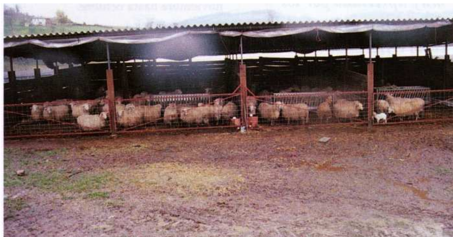
Detalle de la sencillez y bajo coste de las instalaciones

La producción de carne de ovino constituye una opción interesante para rentabilizar la utilización de los recursos pastables en Asturias. El sistema de producción basado en el pastoreo demanda poca mano de obra, pudiendo manejarse un rebaño numeroso por una sola persona. El momento de la paridera exige, sin embargo, especial atención.